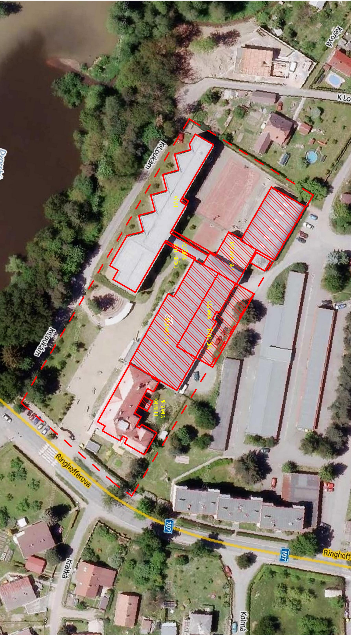
MAPA ŠIRŠÍCH VZTAHŮ (BEZ MĚŘÍTKA)