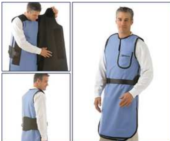
Plášťová (kabátová) zástěra – ze zadání

████████ nabízí 2 modely kabátů bez rukávů: