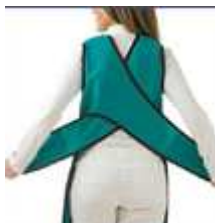
odpovídá našemu modelu