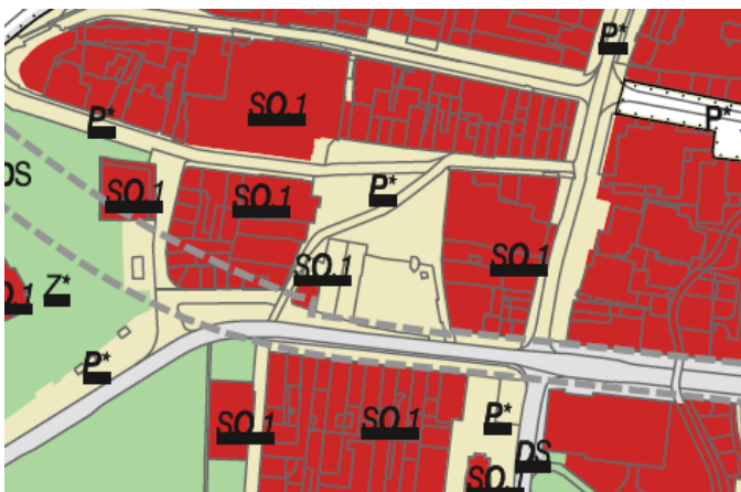
Obr. 2 – výřez z hlavního výkresu platného územního plánu