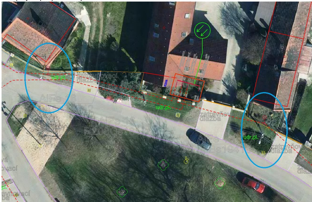
Lampy VO v pasportu jsou chybně umístěny