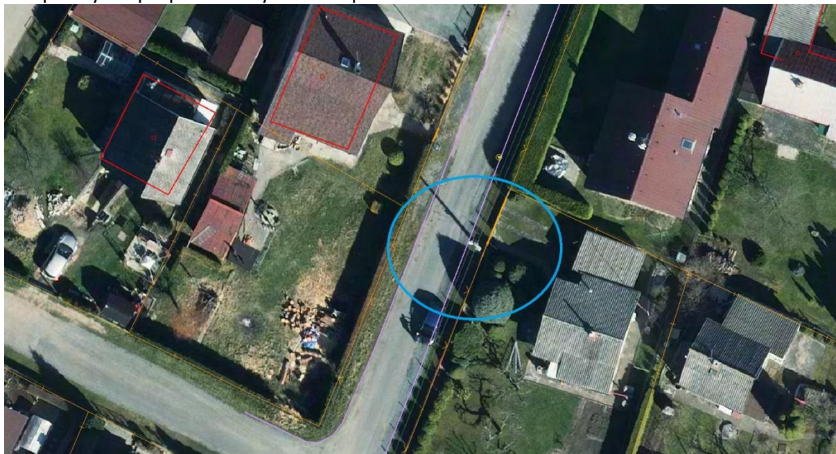
Lampa VO, která chybí v pasportu i v povrchové situaci

Lampa chybí v pasportu a chybí také v povrchové situaci