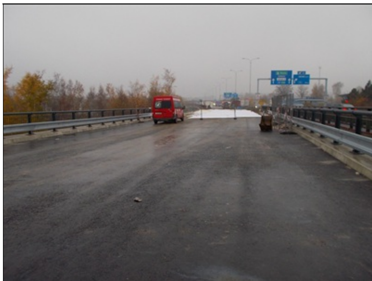
Šířkové uspořádání na mostě, pohled po směru staničení