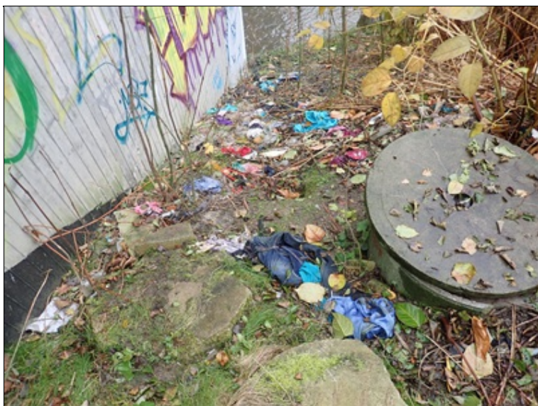
Odpadky v okolí mostu

Výplň protihlukové stěny pokreslena grafity.