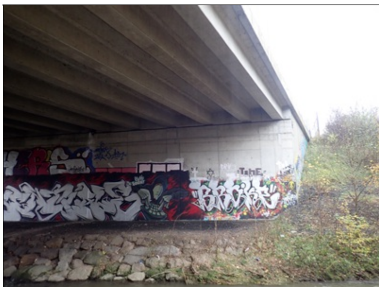
Podhled NK a pohled na 1.opěru

1.2 Mostní podpěry a křídla Obě opěry i křídla pokresleny grafity.