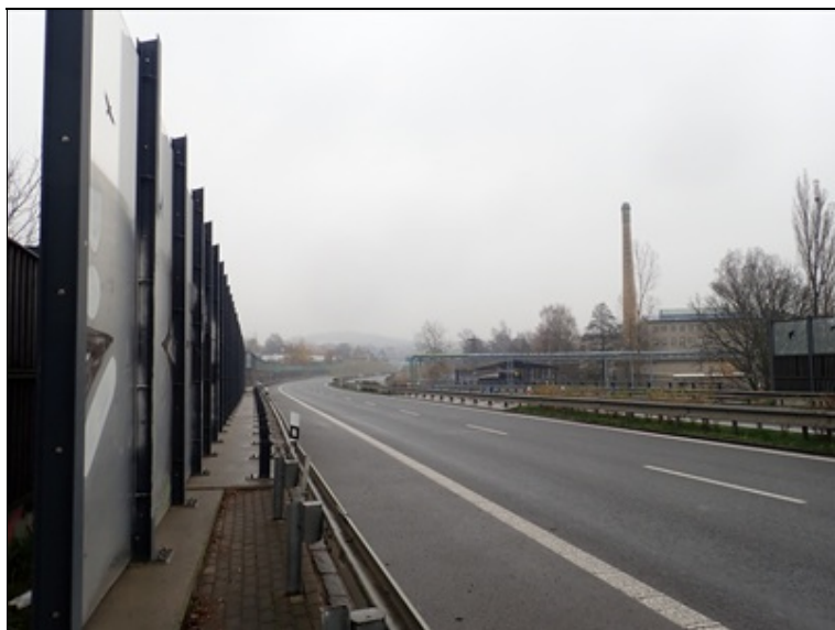
Celkový pohled na most ve směru staničení