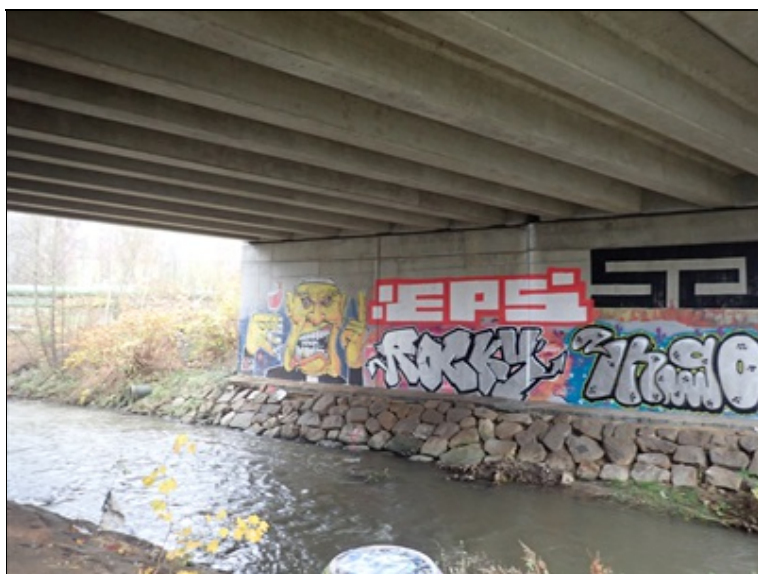
Podhled NK a pohled na 2.opěru

1.2 Mostní podpěry a křídla Obě opěry i křídla pokresleny grafity.