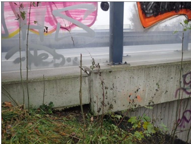
Pokreslená výplň PHS

Výplň protihlukové stěny pokreslena grafity.