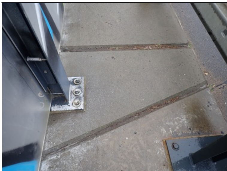
1. dilatace v římse vlevo