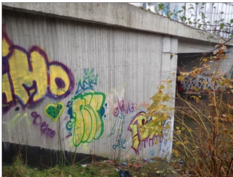
Pohled na 2.křídlo vlevo