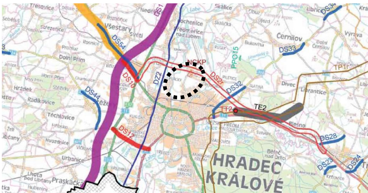
obr.: výřez z výkresu I.2.b.1 ploch a koridorů nadmístního významu platných Zásad územního rozvoje Královéhradeckého kraje s vyznačením zájmového území

Dotčenost navrhovaného záměru uvedenými koridory nadmístního významu byla ověřena pomocí dat z garantovaných souborů informací poskytnutých Krajským úřadem Královéhradeckého kraje, odborem územního plánování a stavebního řádu pro účely zpracování územně analytických podkladů jako záměry vyplývající ze Zásad územního rozvoje Královéhradeckého kraje.