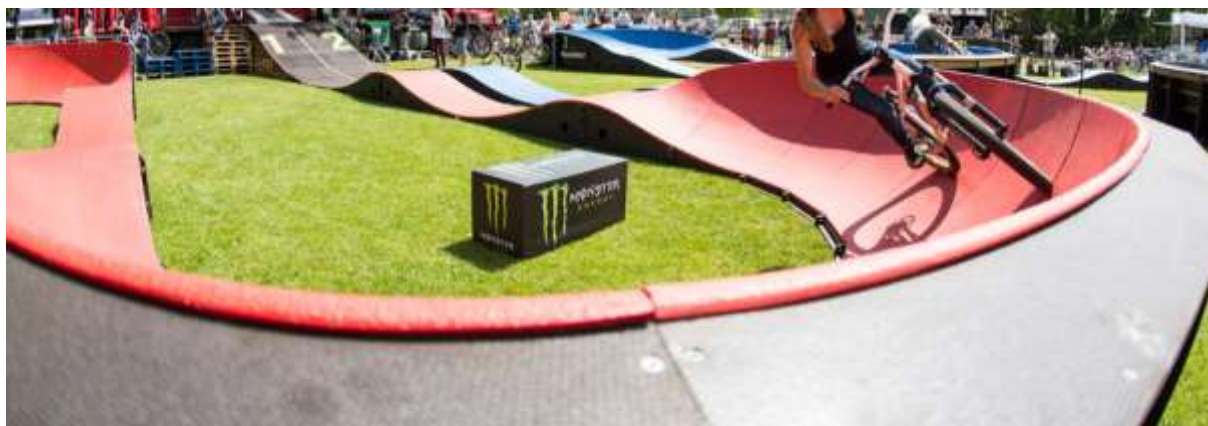
Obrázek č.1– ilustrační obrázek způsobu využití

Hlavním cílem realizace akce je rozvoj doprovodné infrastruktury a služeb cestovního ruchu v destinaci města Písek. Konkrétně se jedná o rozvoj a zkvalitnění stávající infrastruktury cestovního ruchu – Otavské cyklostezky a Zážitkového parku „PARKOUR“. Pumptrack představuje unikátní produkt, který umožňuje celoročně provozovat nový druh volnočasové i sportovní aktivity. K pohybu jízdních kol, koloběžek, skateboardů a inline bruslí po modulární dráze pumptrack se využívá „pumpování“ (pohyb nahoru a dolů) namísto šlapání a odrážení. Pumptrack přispívá k nácvičku a rozvoji široké škály pohybových dovedností všech jeho uživatelů. Jízda na modulárním pumptracku je bezpečná, zábavná a vhodná pro všechny věkové kategorie. Vznikne tak areál pro širokou škálu volnočasových aktivit a lze konstatovat, že především u dospívající mládeže, může být i jakousi prevencí kriminality.