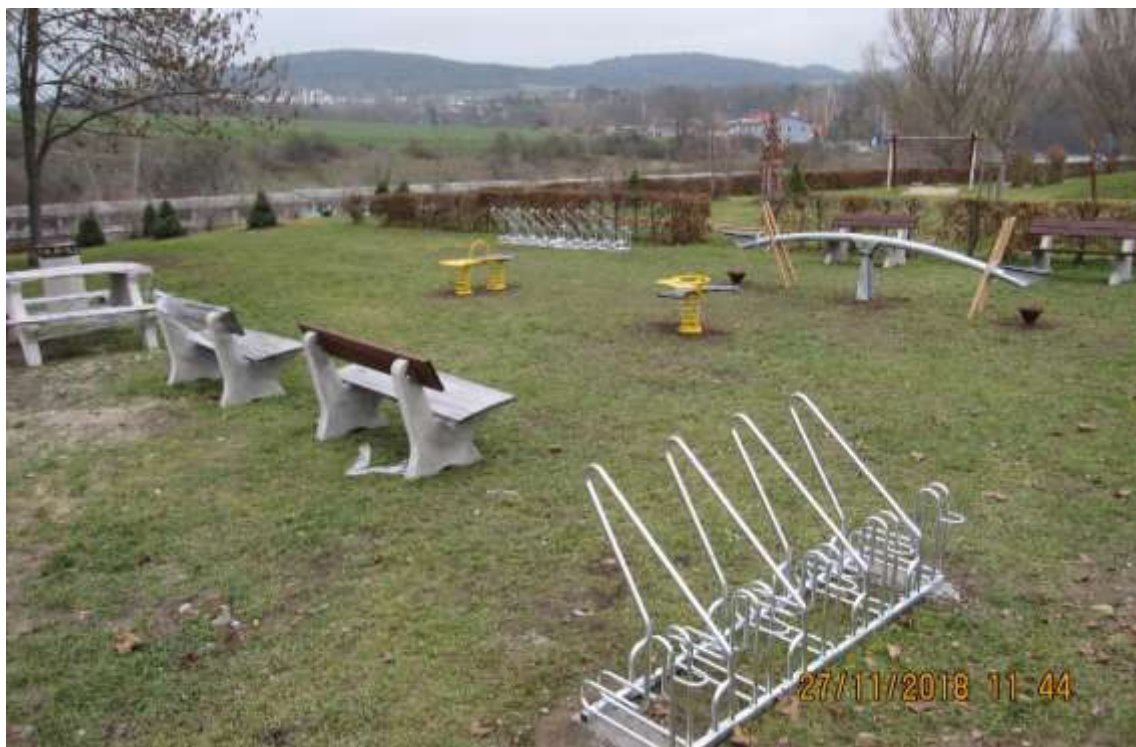
Obrázek č.3, 4 a č.5 – fotodokumentace prostoru odpočinkové zóny v Zážitkovém parku „PARKOUR“

Zázemí odpočinkové zóny pro seniory, rodiny s dětmi a předškolní děti, které je součástí Zážitkového parku „PARKOUR“ bude doplněno o 2 betonové lavice a 2 odpadkové koše. Tento mobiliář je součástí rozpočtu na předmětný projekt – vybudování pumtrackové dráhy.