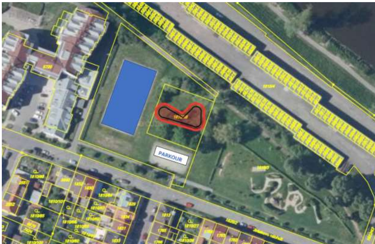
Obrázek č.2 – Situační nákres