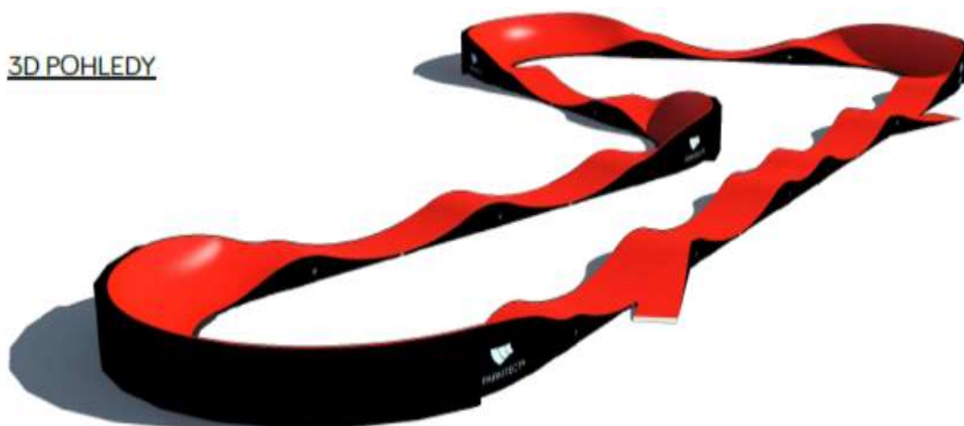
Obrázek č.12– 3D pohled muptrackové dráhy