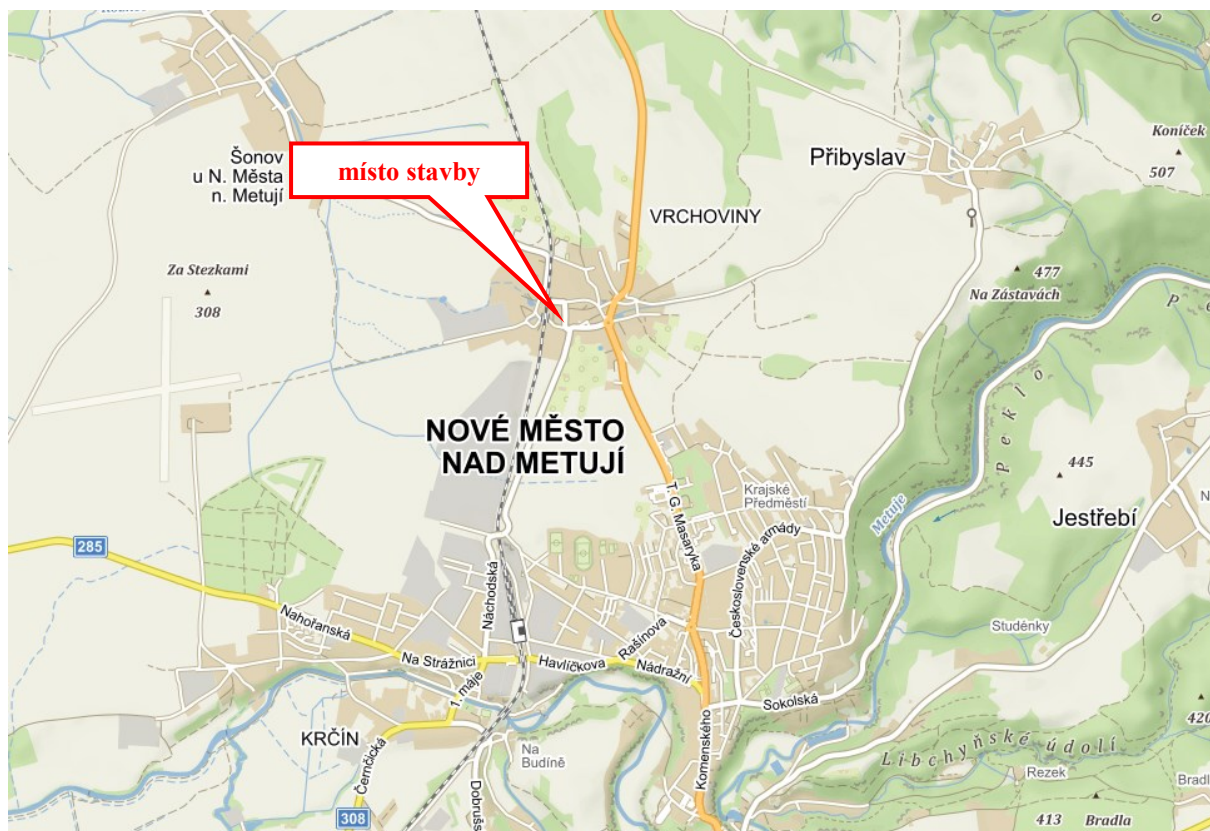
Topografie širšího územního celku

Vodní nádrž Vrchoviny se nachází v k.ú. Vrchoviny, v intravilánu obce Vrchoviny. Vlastní stavba se dotýká pozemku nádrže. Staveniště je přístupné z okolních komunikací.