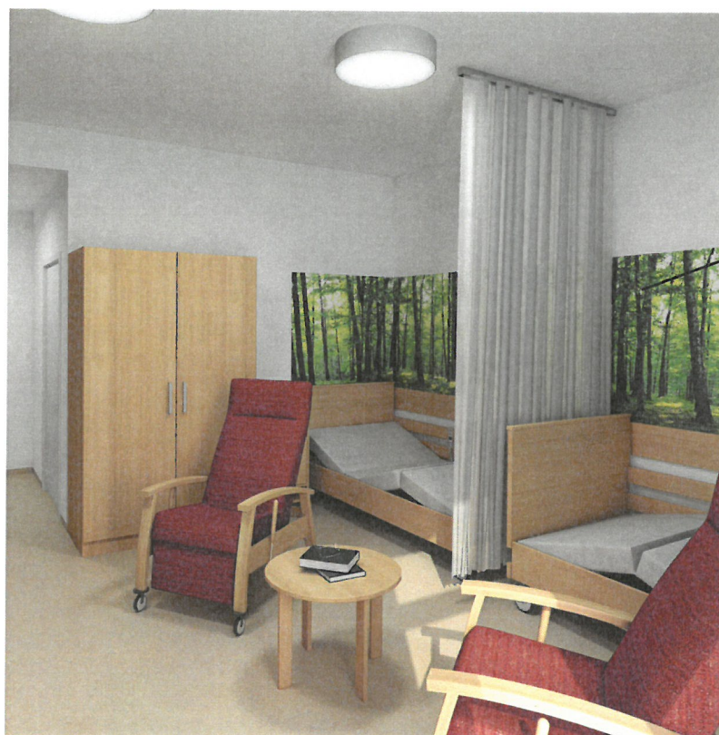
FOTOTAPETA VYZNAČENO V PŮDORYSU JEDNOTLIVÝCH POKOJŮ