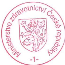
..... MUDr. Svatopluk Němeček, MBA ministr zdravotnictví

4. Toto Opatření nabývá platnosti a účinnosti dnem jeho podpisu ministrem zdravotnictví a je dodatkem č. 3 ke zřizovací listině Fakultní nemocnice Olomouc vydané dne 29. května 2012 pod č.j. MZDR 17266 – V/2012, v úplném znění a její změny č. 1 vydané dne 17. února 2015 pod č.j. MZDR 3292/2015-2/FIN, ve znění změn provedených Opatřením Ministerstva zdravotnictví č.j. MZDR 34015/2016-2/OPŘ ze dne 31. května 2016, které je dodatkem č. 2 zřizovací listiny.