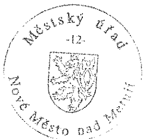
Ing. Miloš Skalský vedoucí odboru výstavby a regionálního rozvoje

Rozhodnutí má podle § 93 odst. 1 stavebního zákona platnost 2 roky. Podmínky rozhodnutí o umístění stavby platí po dobu trvání stavby či zařízení, nedošlo-li z povahy věci k jejich konzumaci.